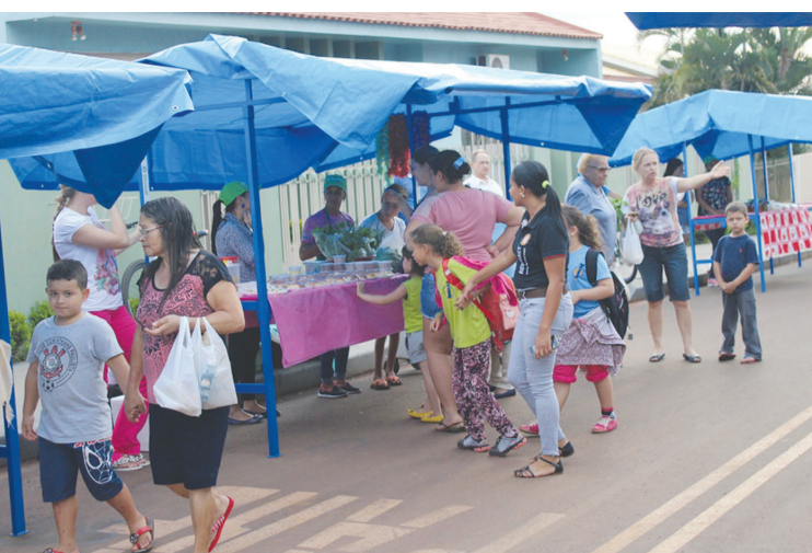
A Feira do Produtor reiniciada ontem está acontecendo defronte ao Destacamento da Polícia Militar