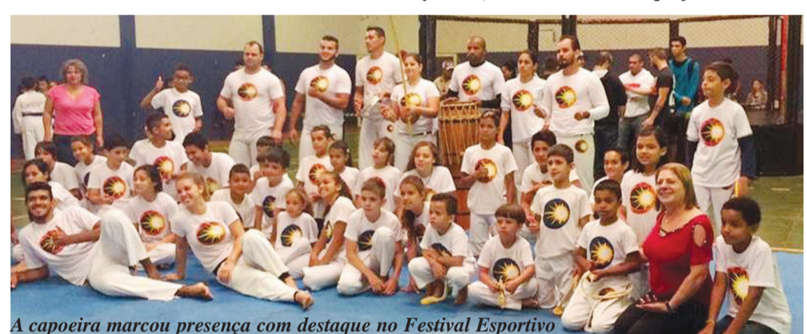
A capoeira marcou presença com destaque no Festival Esportivo