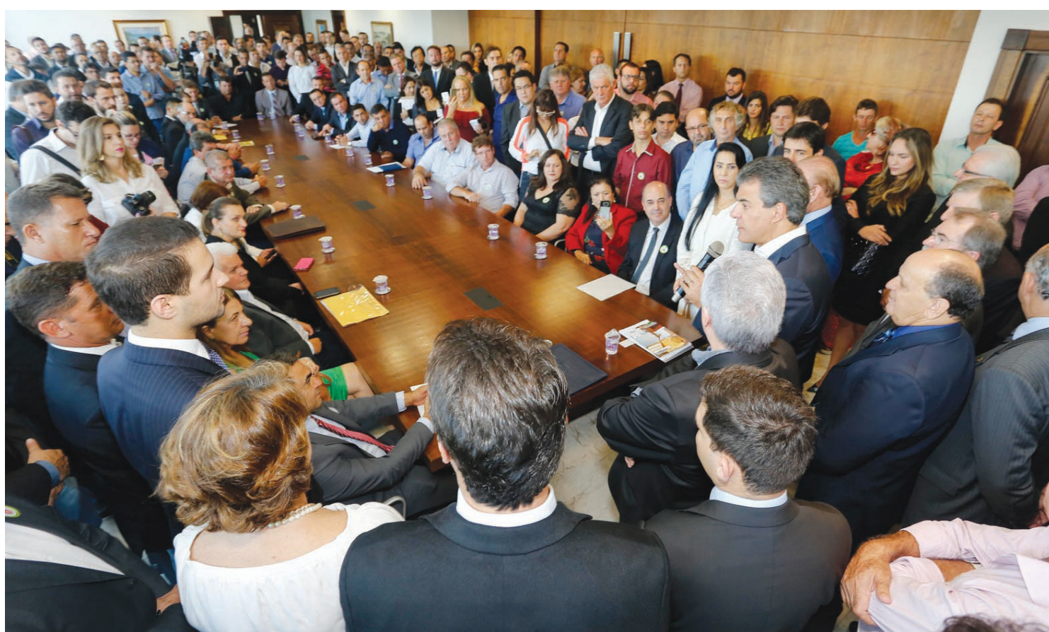
A cerimônia no Palácio Iguazu reuniu mais de uma centena de representantes dos municípios e deputados