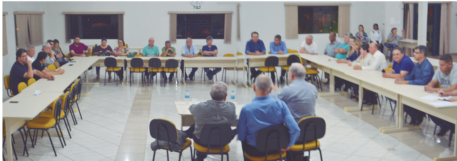
A assembleia realizada na Casa da Amizade foi das mais movimentada

Outro problema levantado durante a assembleia envolve a retenção de parte do repasse que o Ministério da Saúde, através do SUS, repassa mensalmente para a Santa Casa