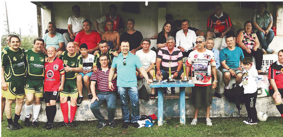
As quatro equipes com atletas misturados

Na manhã de sábado o campo de futebol suíço do Goioerê Clube de Campo recebeu 4 equipes integrada por “dinossauros” que participaram de uma manhã das mais festivas.