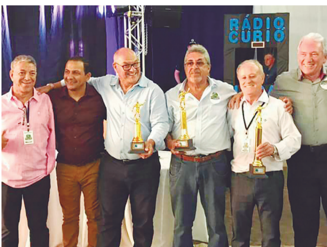
A entrega da premiação do Dino Jogo foi realizada no Dino Baile

A noite, durante o Dino-Baile foi realizada a entrega dos troféus às equipes que participaram dos jogos de confraternização.