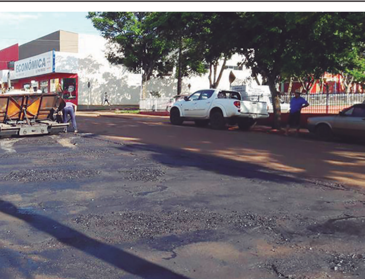
Recapeamento asfáltico da Avenida Brasil