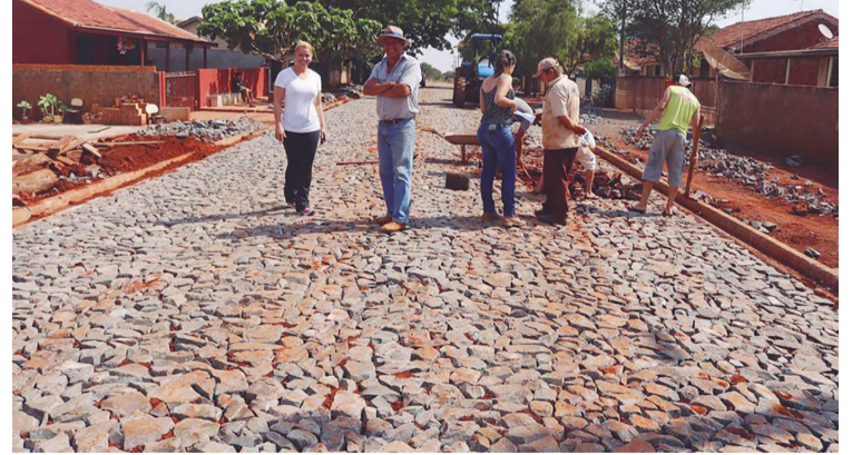
Calçamento com pedras irregulares em Rio Verde