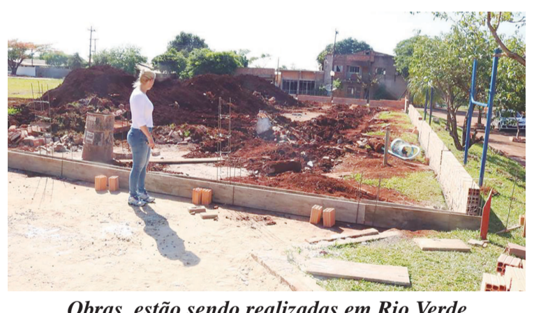
Obras estão sendo realizadas em Rio Verde