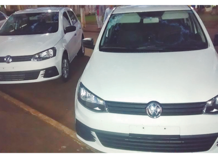
Rio Verde e Primavera receberam veículos para a saúde

A Unidade de Saúde de Primavera recebeu veículo que vai melhorar ainda mais o atendimento da população através da saúde pública do distrito.