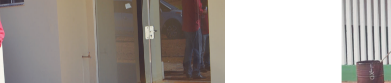
Vistoria na Capela Mortuária