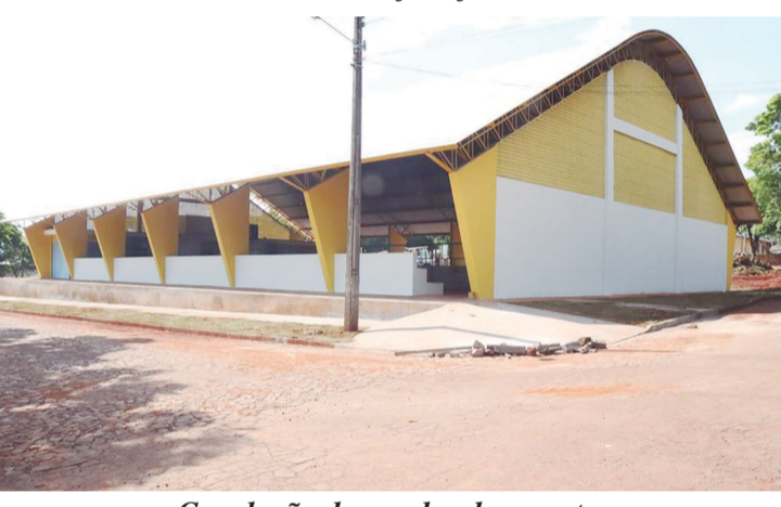
Conclusão da quadra de esportes