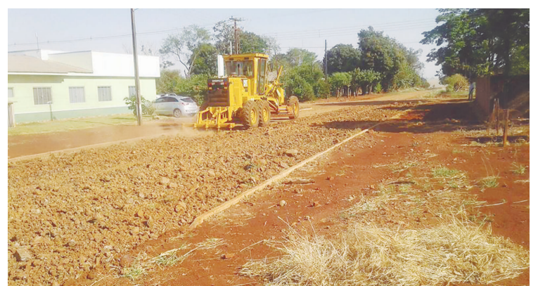
Calçamento com pedras irregulares em Primavera