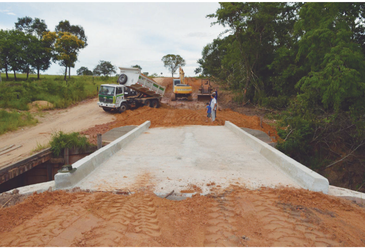
Diversas pontes foram alargadas

em relação a malha viária, outro importante trabalho ficou por conta da readequação das estradas municipais. Quase todas as regiões do interior do município foram atendidas com readequação e cascalhamento.