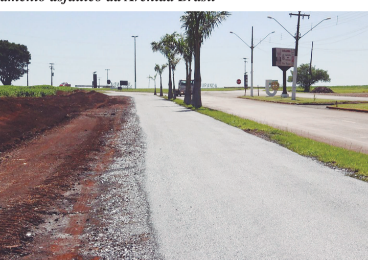
Pista de Caminhada em fase final de conclusão