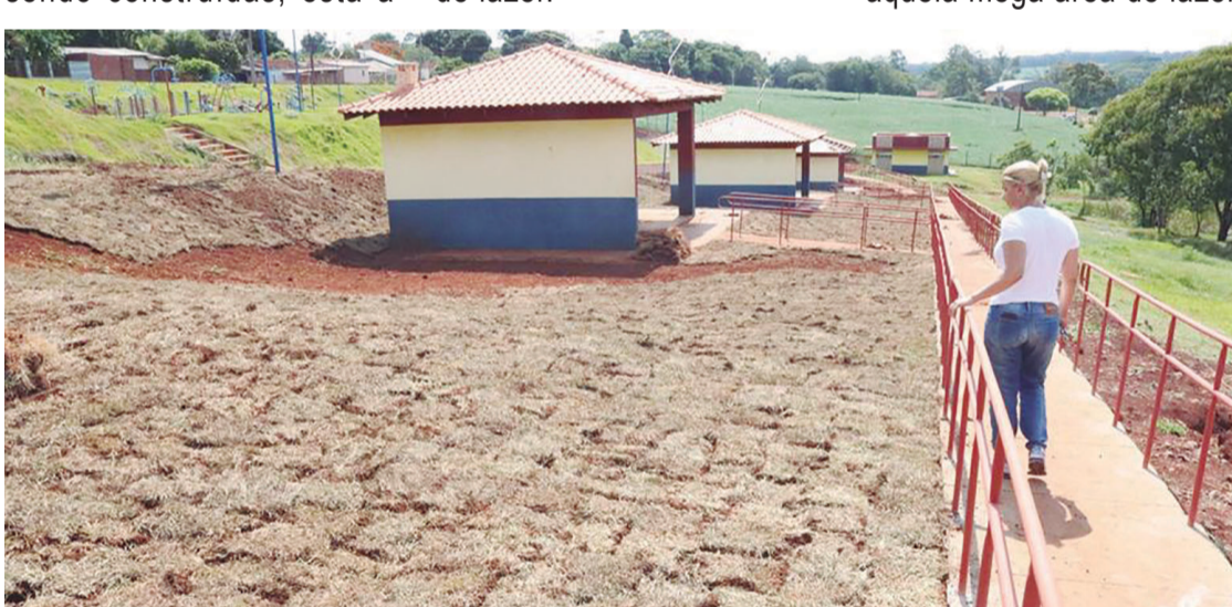
As obras do Parque Ecológico foram retomadas pela prefeita Leila

Além das passarelas e dos corrimãos que dão acesso aos quiosques e a área das represas, diversas obras serão complementadas para que possa ser utilizada pela população jurandense que em breve passa a contar com aquela mega área de lazer.