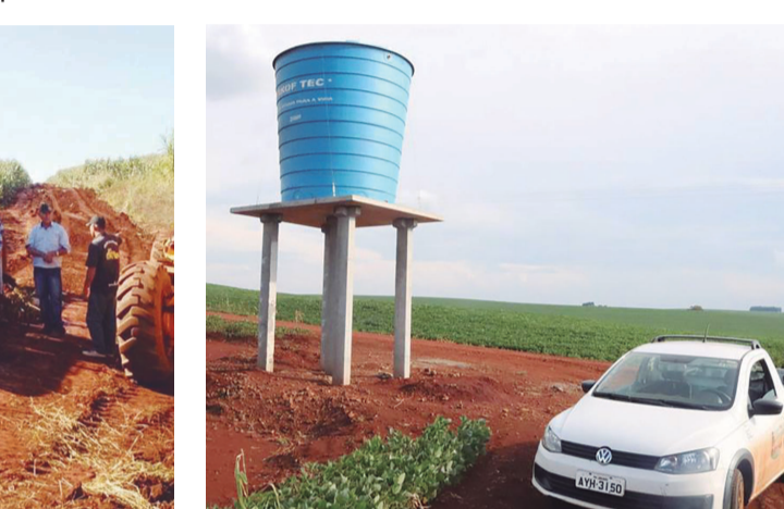
Diversos abastecedouros comunitários foram instalados