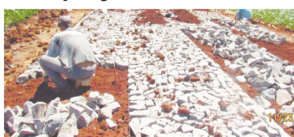
Pedra irregular na estrada da Gleba XV

A constante adequação da malha viária tem como objetivo atender aos produtores rurais, os avicultores e o transporte dos alunos.