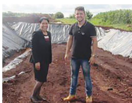
A nova vala no aterro sanitário

Dentre os inúmeros projetos executados na atual gestão, destaque para o programa de coleta de lixo, que está melhorando a vida de dezenas de coletores de material reciclável, cujo setor recebeu investimento de cerca de R$ 80 mil na implantação de uma vala no aterro sanitário. Em relação a coleta de lixo, a prefeita Suely investiu na coleta seletiva bem como instituiu o programa de coleta seletiva apoiando a associação de coletores, e lançou o "Programa Coleta Seletiva" através do qual foi estabelecido o calendário de dias da coleta seletiva pela Prefeitura.