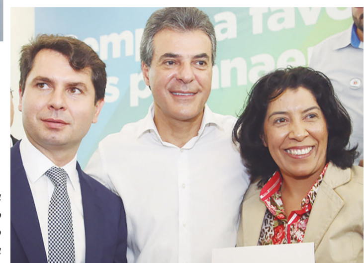
Parceiros importantes: a prefeita Suely, o deputado Alexandre Curi e o Governador Beto Richa