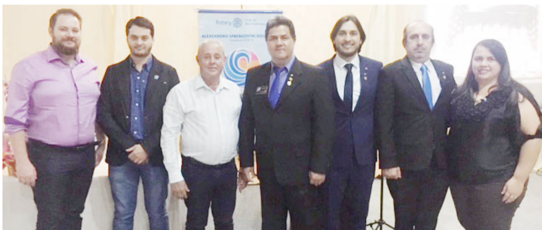
Representantes de Rotary's presentes na Festa de Posse de Boa Esperança