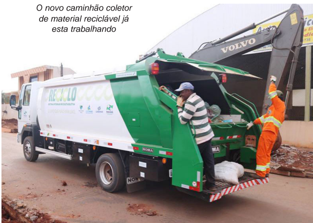
O novo caminhão coletor de material reciclável já esta trabalhando

Entrou em operação nessa semana o novo e moderno caminhão coletor de lixo reciclável de Juranda que começou a operar na coleta de material reciclável no perímetro urbano de Juranda. Foi uma conquista da prefeita Leila Amadei junto ao deputado Artagão Junior um importante parceiro da administração municipal de Juranda.