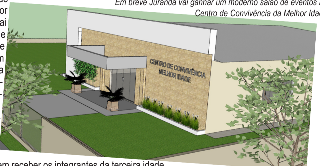
Em breve Juranda vai ganhar um moderno salão de eventos no Centro de Convivência da Melhor Idade

O projeto envolvendo cerca de 300 metros quadrados vai contar com amplas acomodações para bem receber os integrantes da terceira idade que passarão a contar com um moderno salão de eventos conforme proposta da prefeita Leila Amadei.