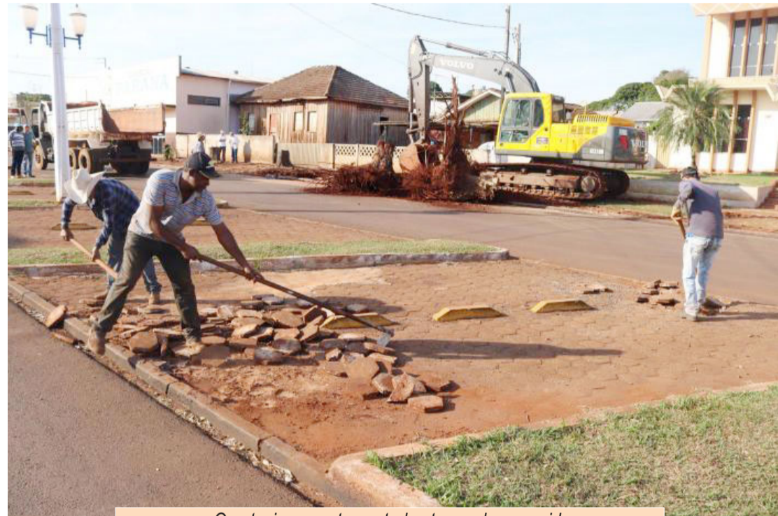
O estacionamento central esta sendo removido