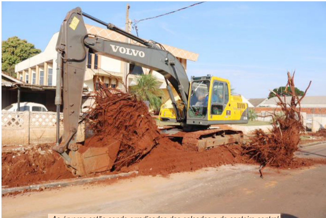
As árvores estão sendo erradicadas das calçadas e do canteiro central