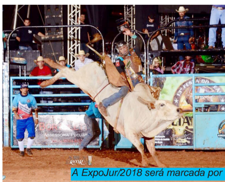
A ExpoJur/2018 será marcada por um super rodeios em touros e cavalos

Com abertura prevista para sexta-feira, 20, a ExpoJur prossegue até o domingo, dia 22. Durante 3 dias muitas atrações estarão acontecendo no