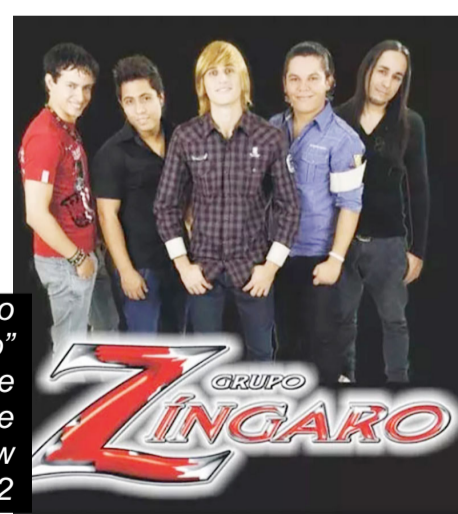
O "Grupo Zingaro" promete destaque no show domingo, 22